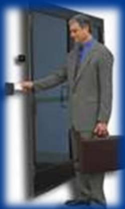
Lector fijo controla la puerta

El control del acceso y del personal, pueden ser administrados y por medio lectores fijos o portátiles los cuales se conectan a una computadora donde se visualiza la información en tiempo real.