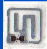
CHIP DE RFID.