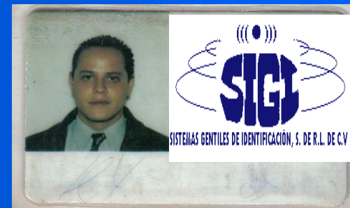
CREDENCIAL DE ACCESO

Permanente, la cual esta habilitada por un periodo de tiempo, con acceso a aéreas determinadas ejemplo: credenciales para trabajadores, estudiantes, personal de seguridad, etc.